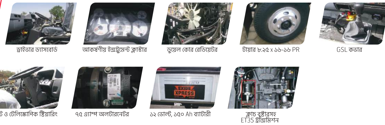
ড্রাইভার ডায়ালগ, আকর্ষণীয় ইন্সট্রুমেন্ট ক্লাস্টার, ডুয়েল কোর রেডিওস্টার, টায়ার ৮.২৫ x ১৬-১৬ PR, GSL কভার, চিল্ট ও টেলিস্কোপিক স্টিয়ারিং, ৭৫ গ্র্যান্ড অলটারনেটর, ১২ ভোল্ট, ১৫০ Ah ব্যাটারী, ক্লাচ বৃষ্টিরসহ ET35 ট্রান্সমিশন